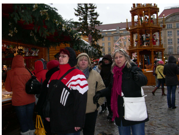
Výlet do Drážďan