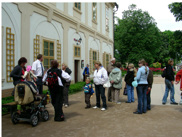
Výlet na zámek Loučeň