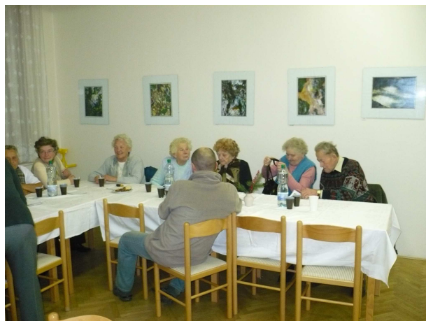
Odpoledne pro seniory